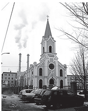
Рис. 3. Католический храм Святого Николая сейчас [4]