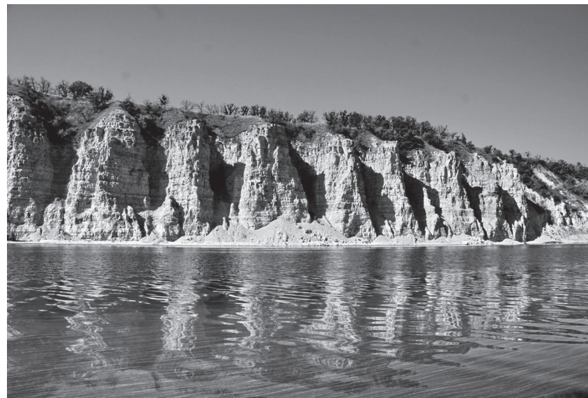
Рис. 1. Столбичи

Но если наш трёхпалубный теплоход относится к Волжскому объединенному речному пароходству, то двухпалубный его собрат — к Камскому пароходству. Кстати, до революции наша компания именовалась «Водоходъ». И ее символы присутствуют на информационных материалах, в радиоинформации. В Саратове я бывал много раз, поэтому на берег не сходил. С теплохода видны новостройки, в том числе 20—30-этажные небоскрёбы, однако они не портят вида старого города и исторической церкви! Но высоты все же заслоня-