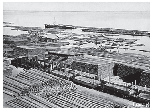
Рис. 6. Первый паровой лесопильный завод в Ельшанке [6]