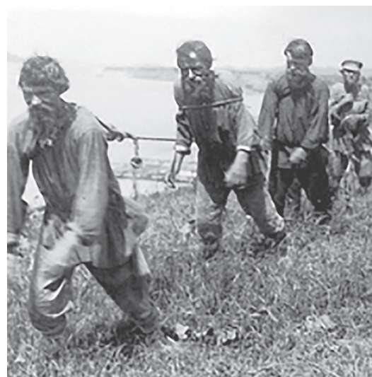
Рис. 7. Бурлаки. Волга. Начало XX в. [6]