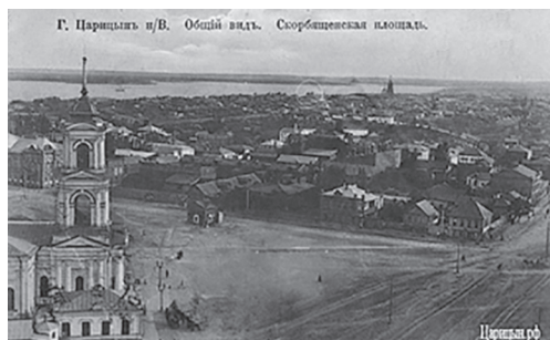
Рис. 4. Старообрядческий храм [7]