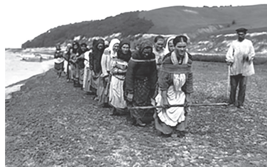
Рис. 8. Бурлачки [2]