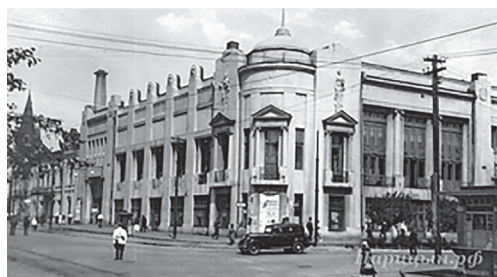
Рис. 5. Вид кинотеатра «Парнас» в 1930-е гг. [5]